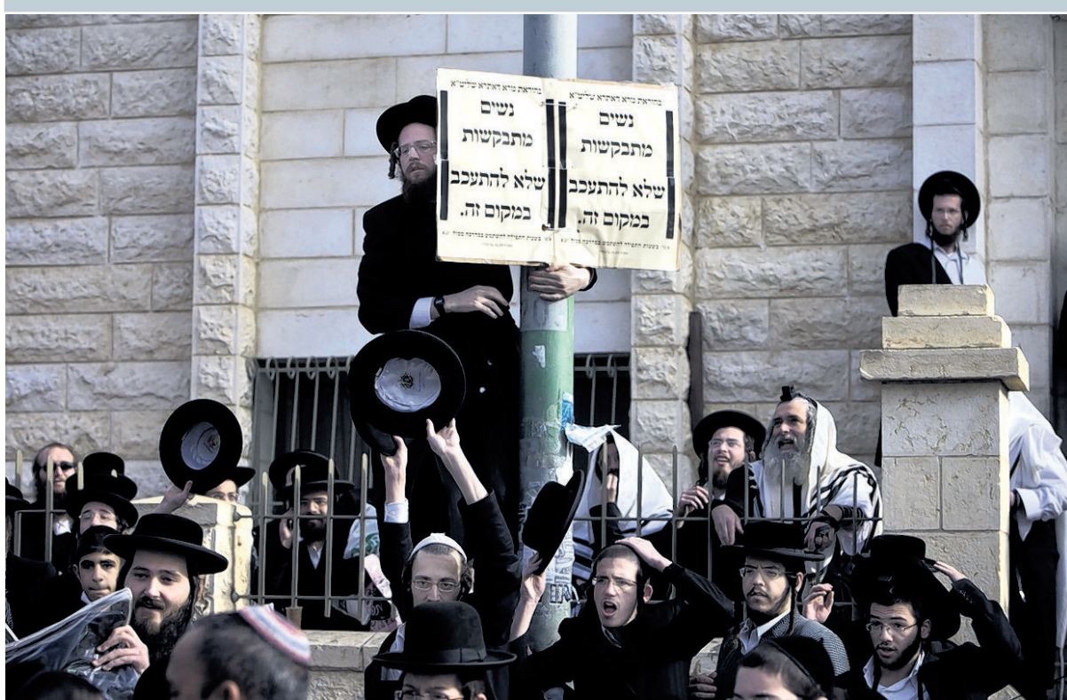
Ultra-orthodoxe joden in Beit Sjemessj laten zich horen. Het bord roept vrouwen op om uit de buurt te blijven.

‘Regering doet niets uit angst voor radicale groepen’